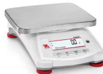
Modello PX12001 e PX12001/E

Quattro tasti rapidi consentono un facile funzionamento con più modalità di pesata.