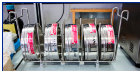
SS-200 con setacci