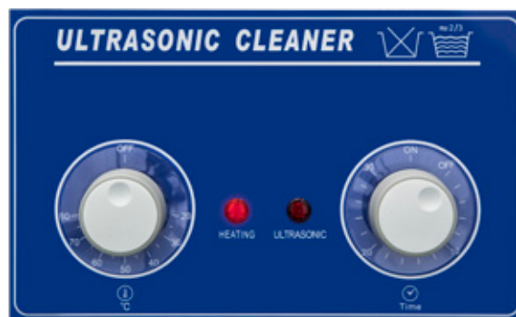
Pannello frontale serie AU