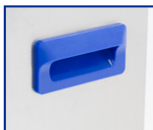
Maniglia per il trasporto