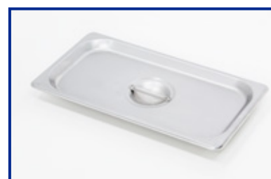
Coperchio in acciaio inox