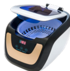
CE-5700A con cestello standard

L'intuitività e la sua versatilità di utilizzo lo rendono un elemento indispensabile per ogni laboratorio.