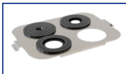
Supporto Becker per DU-100