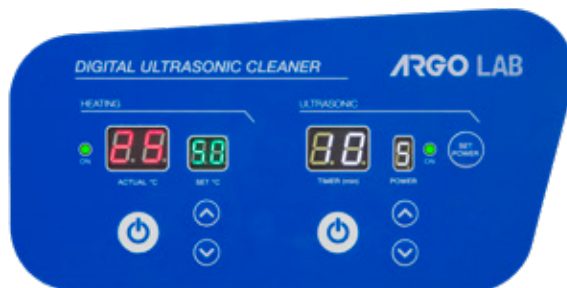
Pannello frontale serie DU

Tutti i modelli sono forniti di cestello a rete in acciaio inox, coperchio in acciaio inossidabile e detergente di pulizia universale