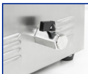
Valvola di scarico per i modelli DU-100, AU-220 e AU-450