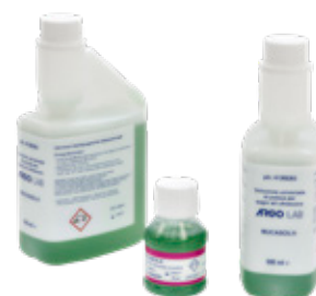
Soluzioni di pulizia universale